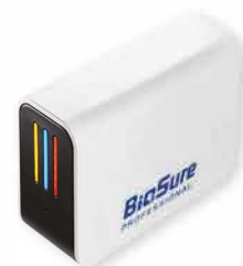
Wyświetlacz ze wskaźnikiem (opcjonalne)